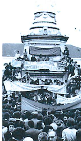
VALORES PRÓPRIOS MAR/ABR 2014