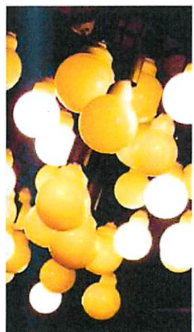
VALORES PRÓPRIOS SET/OUT 2014