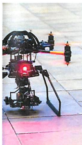
VALORES PRÓPRIOS MAI/JUN 2014